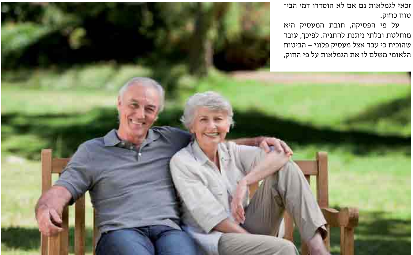
שורה ארוכה של הנחות והטבות למקבלי קיצבת זיקנה

על פי הפסיקה, חובת המעסיק היא מוחלטת ובלתי ניתנת להתניה. לפיכך, עובד שהוכיח כי עבד אצל מעסיק פלוני – הביטוח הלאומי משלם לו את הגמלאות על פי החוק,