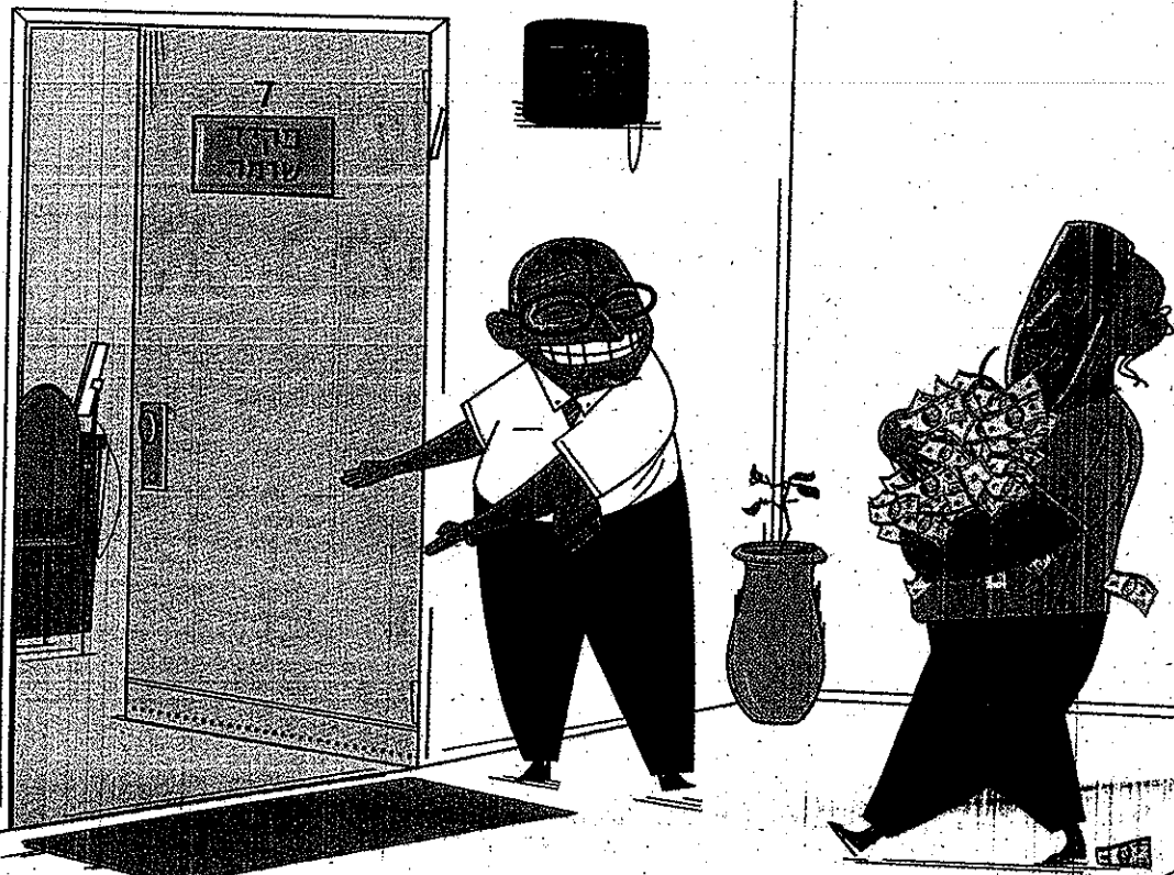
איור: ליליאן אפרת

עיקר הגילויים מרצון הם על חוץ שלא משנה אם נוצר בחו"ל או לא, אבל כרגע נמצא בחו"ל. המטרה היא לנסות להכניס את החוץ שנמצא בחו"ל למערכת המיטרי בישראל. את המס על החוץ הפינגסים שנצברים על החוץ. כל גישום ישלם עבור 10 השנים האחרונות - כולל ריבית והפרשי הצמדה ואפילו קנסות, לפי שיקול דעתו של פקיד השדר מה. שיעור המס במקרה הזה ינוע ברוב המקרים בין 20%-25% בנוסף, במקרים מסוימים תדרוש רשות המסים גם תשלום מס על החוץ הבסיסי. זה יקרה כאשר החוץ נצבר בעיקר בתקופת שנות 2003, שבהן לא חלו פטורים מתשלום מס על פעילות לוחות של ישראלים בחו"ל. שינוי מס זה ינוע בין 10%-50% (כולל מס יפה). טוב מביאה כדוגמה מקרים שבהם החוץ נוצר מירושות או מפעילות בחו"ל לפני 2003, ואם לא יחול חיוב במס על החוץ - אלא רק על הרווחים הפינגסים (כמו ריבית ריוורנד רווחי חוץ) מ-2003. לעומת זאת, במקרים אחרים כמו למשל בעסקות תיווך בגרמ"א או ברכישות ומימון שנוצרו אחרי 2003, החיוב יהיה לא רק במס על הרווחים הפינגסים, אלא גם החוץ הבסיסי - חיובי עד שיעור המס השולי - כולומר עד 48%.