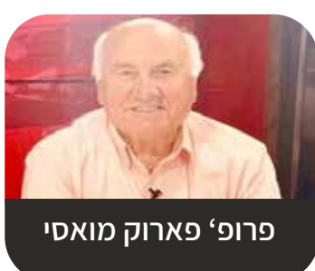
פרופ' פארוק מואסי